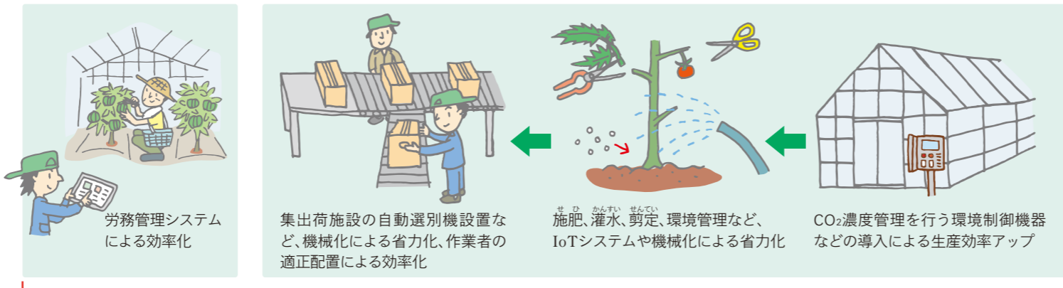
例 ハウス園芸における生産性向上の取り組み

IOT(モノのデジタル化・ネットワーク化)とは「Internet of Things」の略で、日常の身の回りにあるあらゆるモノがインターネットにつながって効果的に活用される仕組み